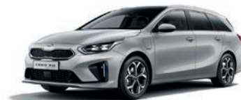
Sparkling Silver (KCS) (metalliväri)