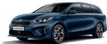
Cosmos Blue (CB7) (metalliväri)