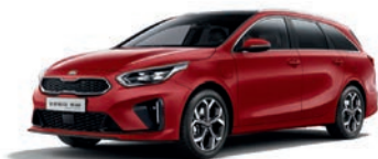
Infra Red (AA9) (metalliväri)