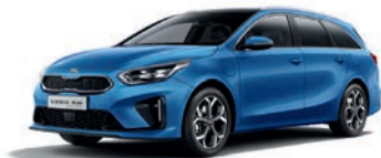
Blue Flame (B3L) (metalliväri)