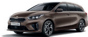
Copper Stone (L2B) (metalliväri)