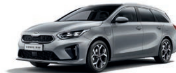
Lunar Silver (CSS) (metalliväri)