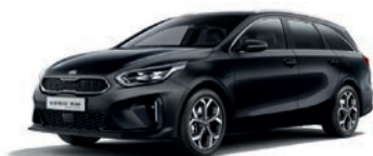
Black Pearl (1K) (metalliväri)