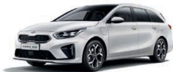
Cassa White (WD) (perusväri)