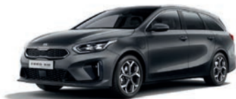
Dark Penta Metal (H8G) (metalliväri)